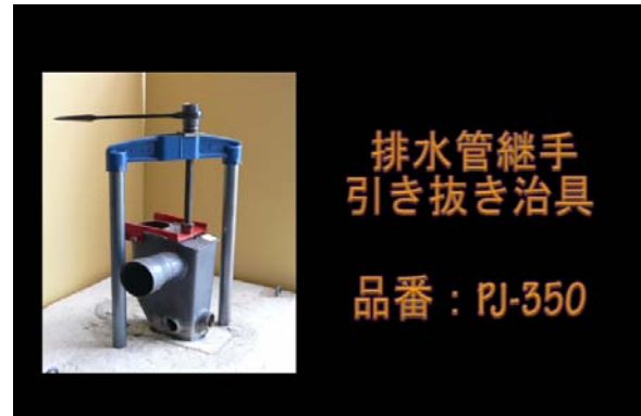
プルッシュジャッキを用いてソベント継手を引き抜く動画