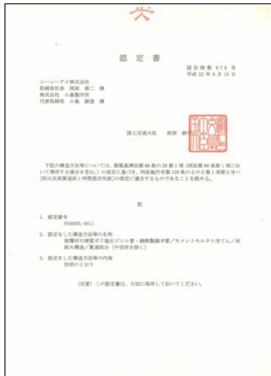
国土交通大臣認定取得品 認定番号: PS060FL-0511