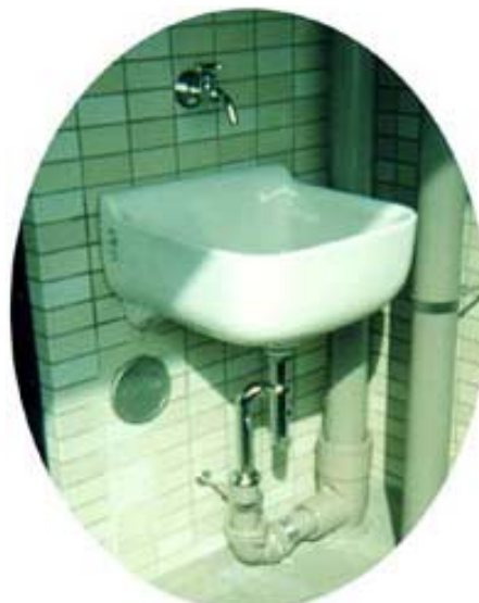
写真はKST-S 80 × 50