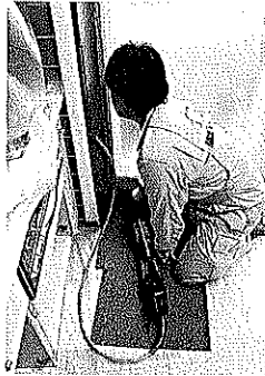
引き抜き排水主管を手動式油圧ジャッキを設置してわずか数分引き抜きが完了